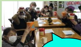
クリスマスビンゴ大会