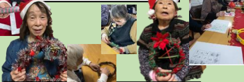
クリスマスリース作り