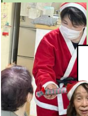
サンタさんからのプレゼント

今年もきずなにクリスマスがやってきました。さつまいもの茎のリースづくりでお部屋を飾り付けました。クリスマスビンゴで盛り上がりました！良い子だけでなく、良いおばあちゃん・おじいちゃんにもサンタさんはやってきました。23・24・25日と日替わりで楽しみました。