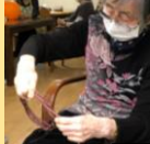
丸めて干して固まったら